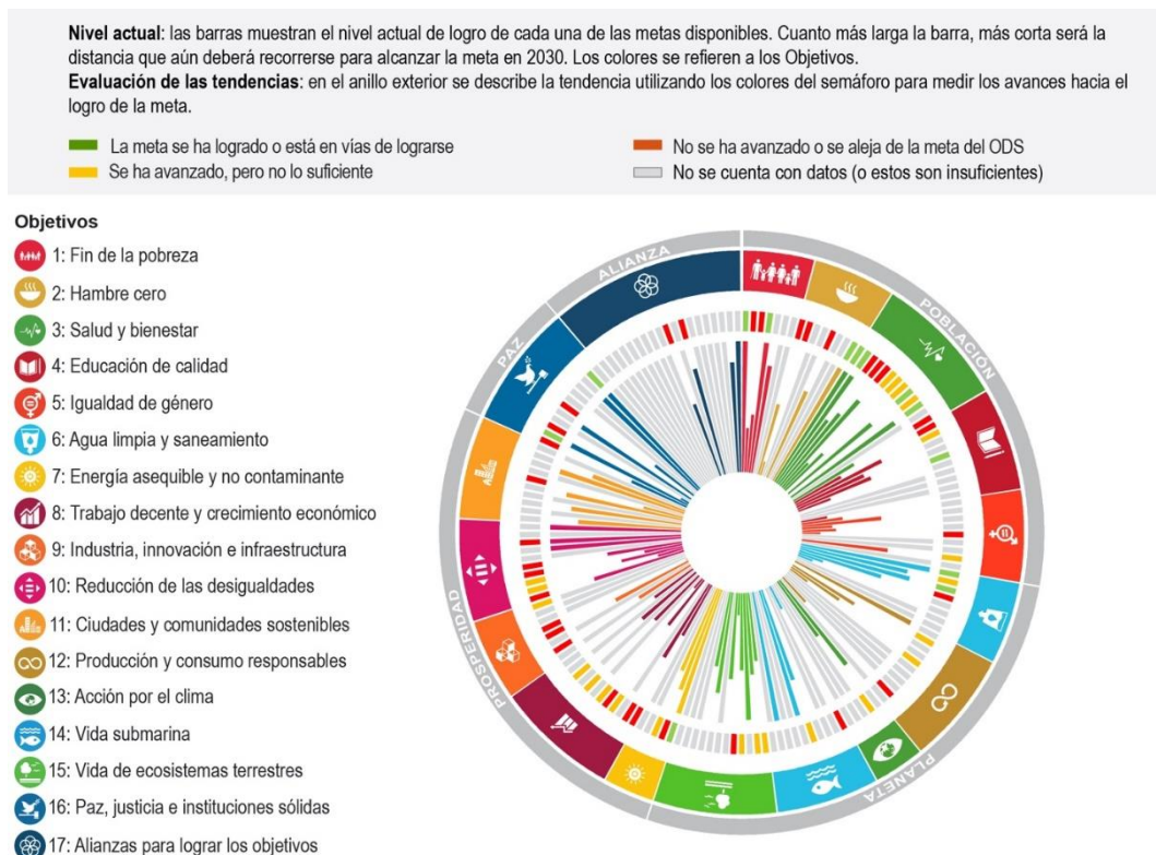
Gráfica 1. Chile: Distancia por recorrer para lograr las metas de los ODS incluidas en este informe