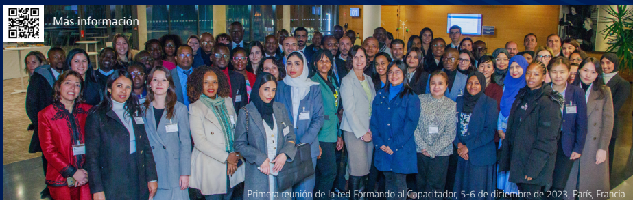
Primera reunión de la red Formando al Capacitador, 5-6 de diciembre de 2023, París, Francia