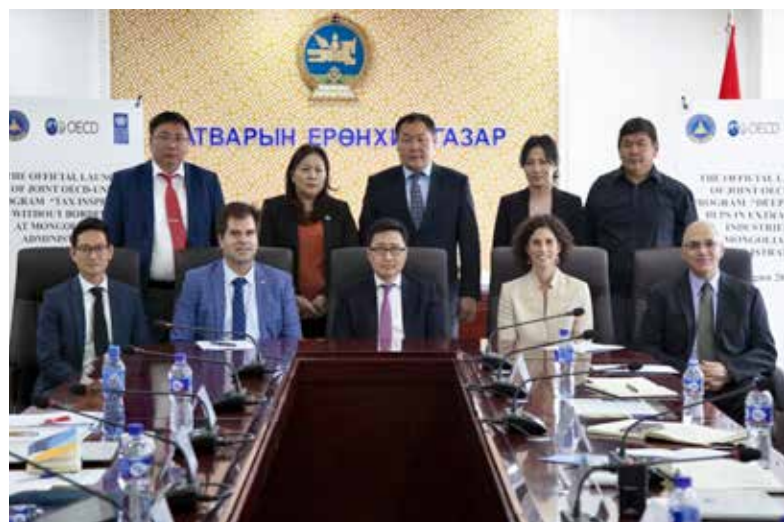
ЭЗХАХБ болон ЗГХФ-ийн Уул уурхайн салбарт Татварын суурийг багасгаж, ашиг шилжүүлэхийн талаарх Deep Dive хөтөлбөрийн нээлтийн арга хэмжээ, Монгол улс, Улаанбаатар хот (2019 оны 8-р сар).

Монгол Улсад олон төсөл хэрэгжүүлж буй уул уурхайн компаниуд хайгуулын болон эхний шатандаа яваа төслийн алдагдлыг дуусах шатандаа яваа, орлого олдог олборлолт, үйлдвэрлэлийн татвар ногдох ашгаас нөхөхөөс сэргийлсэн тусгаарлах буюу "ring-fencing" хийх аргыг шинэчлэн батлагдсан татварын хуульд оруулсан. Төслүүдийн орлого зардлыг нэгтгэн тайлагнаснаар компанийн аж ахуйн нэгжийн орлогын албан татвар төлөлтийг хойшлуулах боломжтой болдог. ЭЗХАХБ болон ЗГХФ нь лиценз бүрээр тайлагнах шинэ журмын төслийг боловсруулах чиглэлээр туслалцаа үзүүлж, хэрэгжүүлэх чадавхийг бэхжүүлэх чиглэлд ажиллаж байна. Энэ журам нь Аж ахуйн нэгжийн орлогын албан татварыг зохиомлоор хойшлуулахаас сэргийлж, татвар хураалтын хугацааг урагшлуулж, Монгол Улсад татварын орлогыг хугацаанд нь төвлөрүүлэх, татварын орлогыг төлөвлөхөд хялбар болгоно.