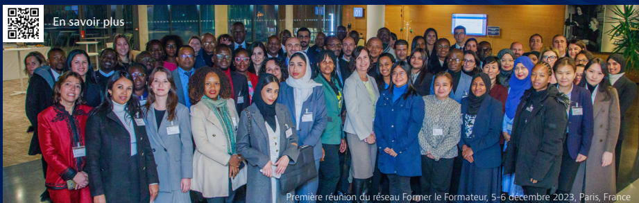
Première réunion du réseau Former le Formateur, 5-6 décembre 2023, Paris, France