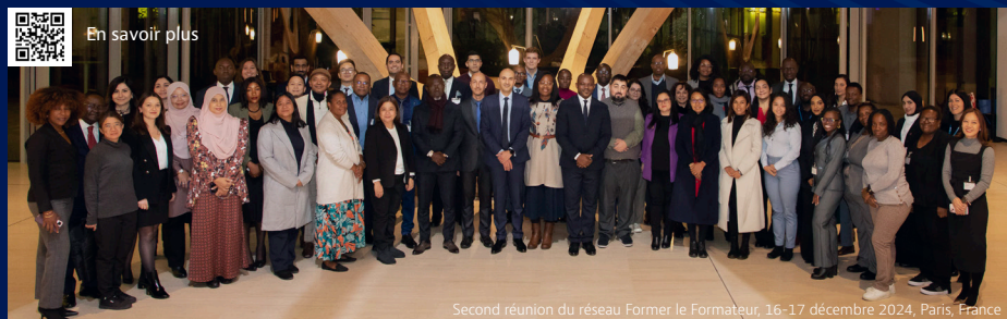
Second réunion du réseau Former le Formateur, 16-17 décembre 2024, Paris, France