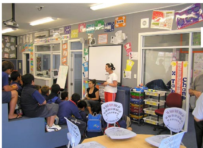
École primaire Papatoetoe South La nouvelle salle

Le plan simple de la salle (voir ci-après) offre un espace suffisant pour accueillir 40 élèves de 11 ans ainsi que leurs deux enseignants. Les salles d'atelier, auparavant utilisées pour le stockage, hébergent à présent un espace robotique pour aider les élèves dans les exercices de résolution de problèmes ainsi qu'un espace calme pour les petits groupes. De grandes portes s'ouvrent sur une vaste véranda utilisée pour l'apprentissage en intérieur/extérieur.