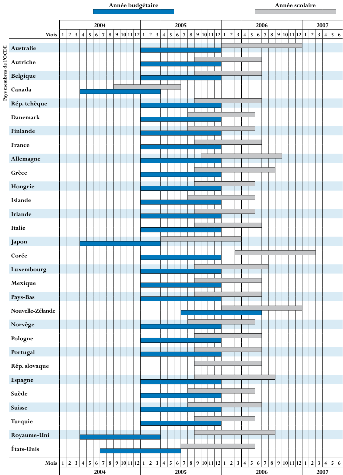
Tableau X1.2a. Année scolaire et année budgétaire utilisées pour le calcul des indicateurs