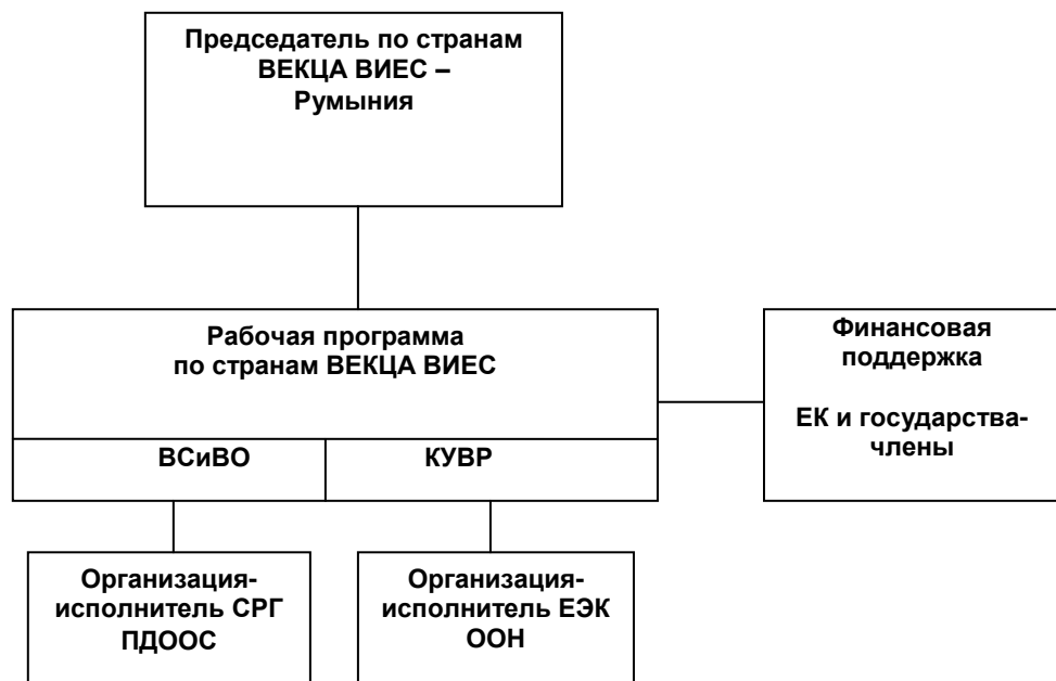
Рисунок 1: Институциональная архитектура Рабочей группы по странам ВЕКЦА ВИЕС

Последняя совместная встреча проходила 12-13 мая 2008 г. в Бухаресте 2 . На этой встрече, в частности, была определена относительная важность предложенных проектов и направлений работы на 2009-2011 гг. Результаты процедуры ранжирования указывают на высокую поддержку всех направлений деятельности по предложенной рабочей программе. Сотрудничество СРГ ПДООС с ВИЕС в проведении национальных диалогов по вопросам отраслевой политики получило особенно высокую оценку делегатов, что свидетельствует о том, что в настоящее время это укоренившееся и высоко оцениваемое направление деятельности. Следующая совместная встреча запланирована на 24-25 ноября 2009 г. в Бухаресте.