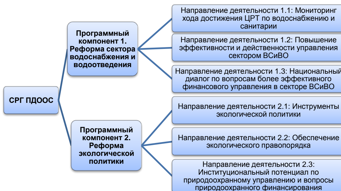
Рисунок 1. Программа СРГ ПДООС: направления и мероприятия

В рамках этих компонентов, при условии выделения достаточных ресурсов, различные мероприятия реализуются: