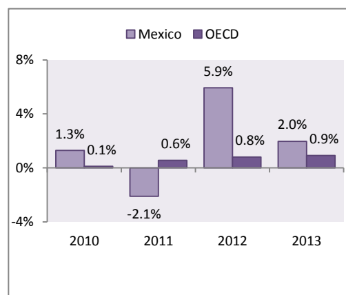
Crecimiento anual del gasto en salud*

*Gasto per cápita en términos reales