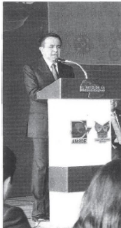
Ildefonso Guajardo, titular de Economía.

La OCDE emitió un total de 16 recomendaciones para México, a fin impulsar la capacidad para diseñar y poner en práctica regulaciones de alta calidad, que promuevan la actividad comercial y empresarial y que a su vez prote-