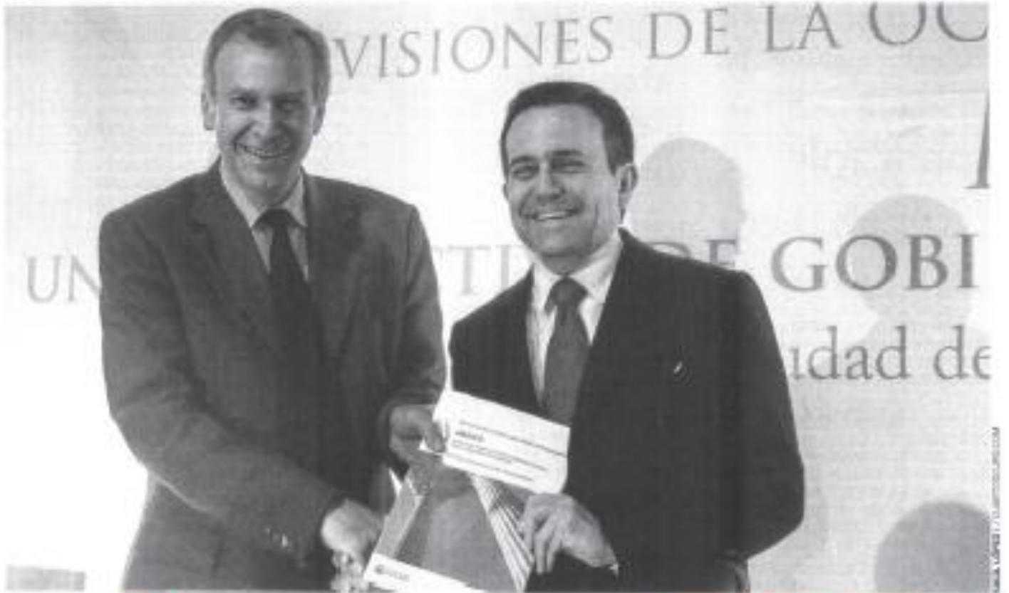
REUNIÓN. El secretario general adjunto de la OCDE, Yves Leterme (izquierda) y el titular de la Secretaría de Economía , Ildefonso Guajardo .