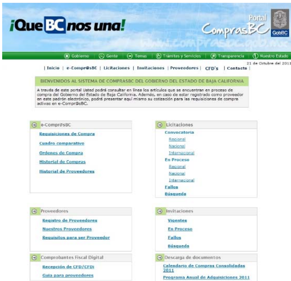
Figura 1. Página de inicio del portal Compras BC

Con el compromiso de avanzar en la apertura y transparencia de los procedimientos de compras, el Gobierno de Baja California desarrolló el portal ComprasBC, por medio del cual se publican las compras por adjudicación directa, invitaciones y licitaciones públicas (figura 1). Esto con el objetivo de lograr una mayor participación de las empresas locales que se interesan en vender al gobierno, en particular las micro, pequeñas y medianas empresas (MIPYMES) del Estado.