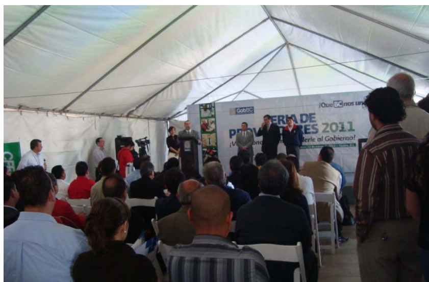
Figura 2. Feria de Proveedores 2011

En paralelo a la utilización del portal, se establecieron desde 2009 las Ferias de Proveedores de Gobierno. En estos eventos, que se realizan cada año en todo el estado, las unidades de adquisiciones del gobierno estatal con mayor volumen de compra exponen a las empresas asistentes qué, cómo y cuándo vender (figura 2). Asimismo, se imparten los talleres "¿Cómo venderle al Gobierno?" y se presentan las herramientas electrónicas bajo las cuales se publican los procedimientos de compras, garantizando la libre participación.