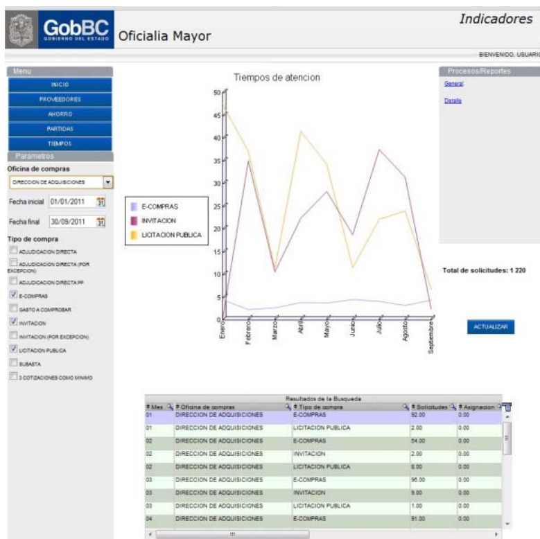
Figura 3. Indicadores generados por el portal

Entre los indicadores utilizados para dar seguimiento al uso del portal sobresalen el porcentaje de procedimientos de compras publicados en Internet y la publicación del nivel de participación y procedimientos ganados por proveedor (figura 3).