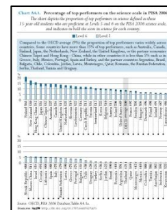
Рис. А4.1. Доля учеников, продемонстрировавших наиболее высокие результаты в области естественных наук, PISA 2006

Влияние полученного образования на возможности трудоустройства более чем когда-либо важно в условиях сегодняшнего сложного рынка труда. С одной стороны, в период экономического спада люди, не имеющие полного среднего образования, сталкиваются с более высоким риском потери работы чем те, кто не получил высокую квалификацию ( Индикатор А6 ). Кроме того, потерявшие