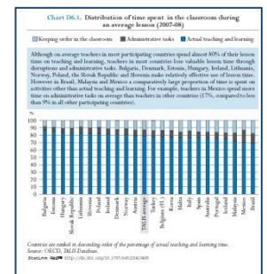
Рис. D6.1. Распределение времени, проведенного в классной комнате, во время урока (2007-2008)

В рамках TALIS также изучались методы обучения, убеждения учителей и их отношение к профессиональной деятельности ( Индикатор D6 ). Хотя в большинстве участвующих в обследовании стран учителя тратят почти 80 % времени, отведенного на урок, на обучение, учителя в большинстве стран теряют драгоценное время урока в связи с различными сбоями и на решение административных задач. Учителя более склонны рассматривать учащихся как активных участников процесса приобретения и конструирования знаний, чем отдавать главную роль педагогу, который транслирует информацию и демонстрирует “правильных решений”. Однако, в классе, учителя во всех странах отдают предпочтение структурированным подходам к обучению, с заданными в явной форме образовательными целями, а не подходам, в большей степени ориентированным на учащегося.