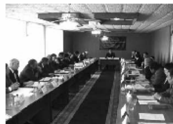
Фото / Видео