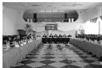
Фото / Видео