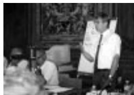
Pr. Stein Evensen

pays ont indiqué qu'il y avait chez eux un niveau élevé d'intégration entre les fonctions des services de santé et des facultés de médecine, dont les responsabilités et les objectifs sont les mêmes mais les priorités différentes : les services et les soins médicaux d'un côté et l'enseignement et la recherche de l'autre. Cela pose aux gestionnaires des services de santé et des universités de nombreux problèmes, sur le plan notamment de l'affectation des crédits pour la recherche, et du temps à ménager pour la recherche pour les médecins qui ont besoin à la fois de progresser dans leur carrière, de trouver des moyens budgétaires et de remplir leurs engagements vis-à-vis des demandes de l'Etat et de la région.