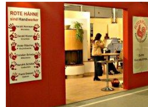
Messestand Roter Hahn eG