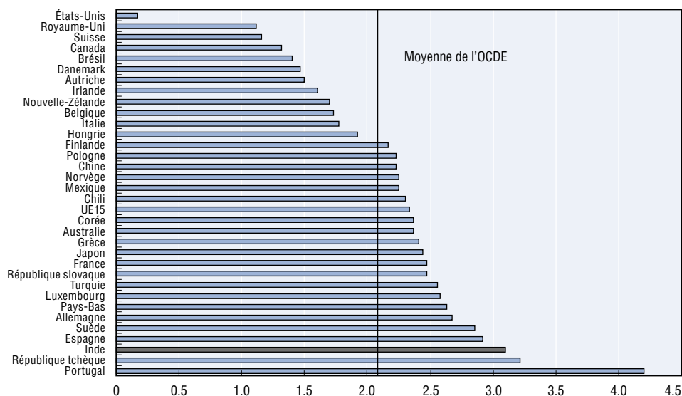
Graphique 2. UNE COMPARAISON INTERNATIONALE DE LA LÉGISLATION DE PROTECTION DU TRAVAIL Emploi régulier (restrictions sur les contrats à durée indéterminée)