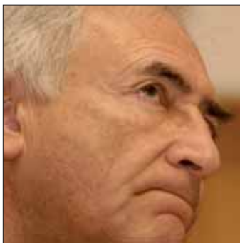
Dominique Strauss-Kahn, page 30

L'Observateur ocde www.observateurocde.org