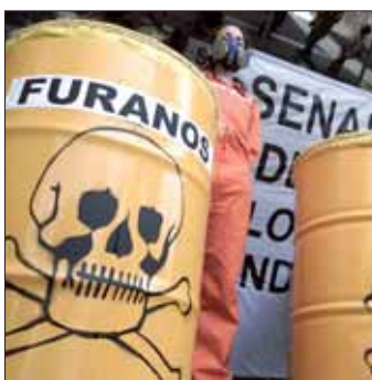
La bonne formule, page 18