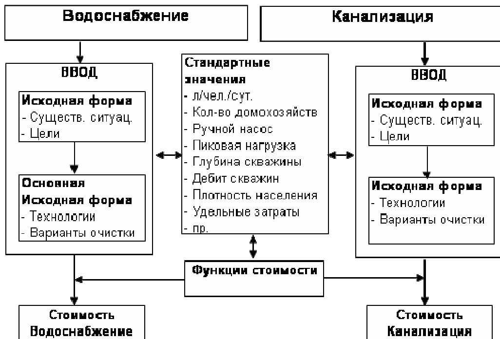
Рисунок 1-1 Общая структура модели затрат

Определение других терминов можно найти в словаре в Приложении 1.