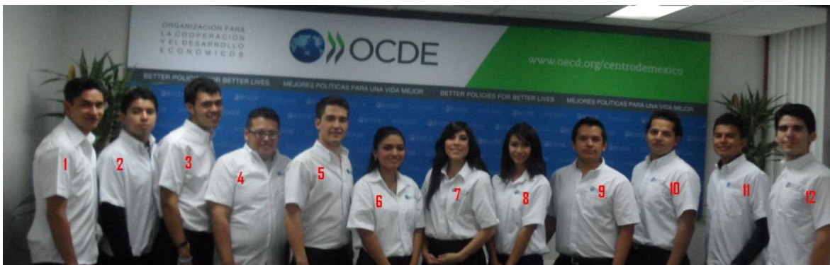
De izquierda a derecha